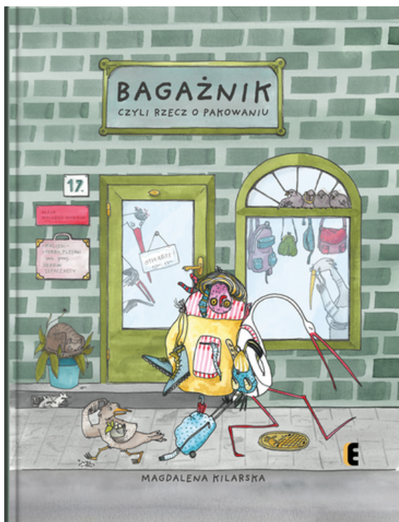
Okładka książki Magdaleny Kilarskiej